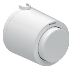
Imagen de ejemplo